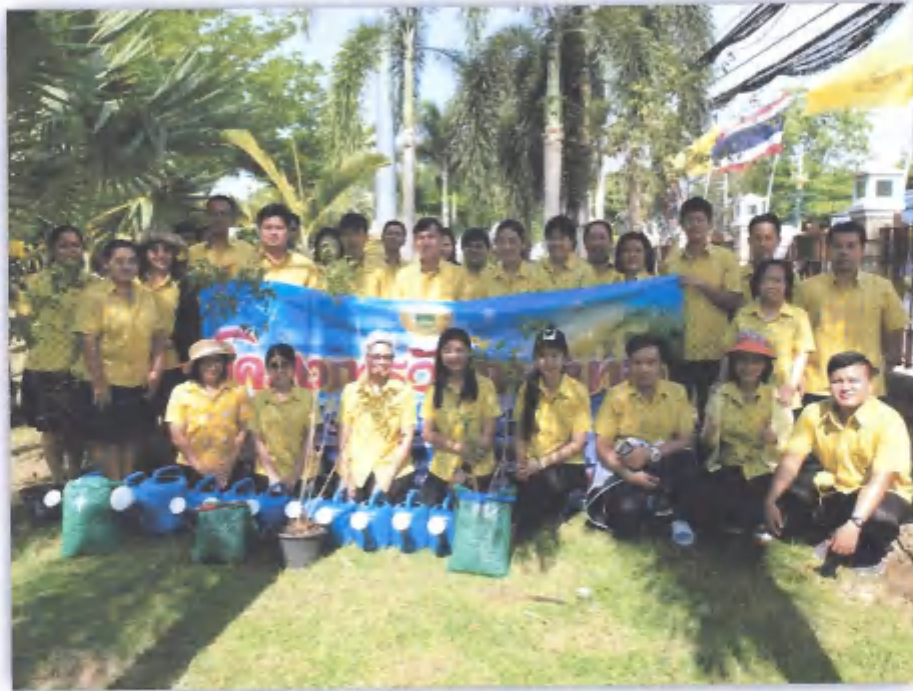
◆ กิจกรรมปลูกต้นไม้ เนื่องในวันเทศบาล