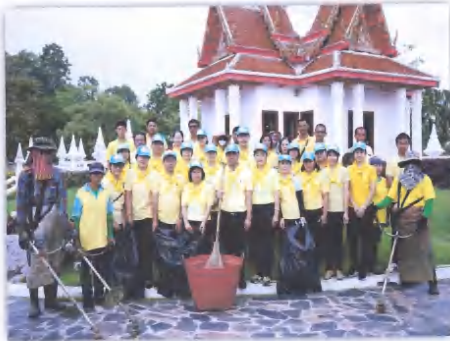
◇ กิจกรรมจิตอาสา พัฒนาบริเวณศาลหลักเมืองทุกวันศุกร์

๒. มีความรักความสามัคคี สำนึกตระหนักถึงส่วนรวมเป็นหลักช่วยเหลือสังคมและส่วนรวม ร่วมมือร่วมใจในการปฏิบัติงาน จะเป็นกิจกรรมที่ต้องทำด้วยความสามัคคีกลมเกลียว อาทิเช่น การร่วมแข่งขันกีฬา สันนิบาตเทศบาลจังหวัดเพชรบุรี การจัดกิจกรรมวันเทศบาล การให้ความร่วมมือในการเข้าร่วมกิจกรรมงานพิธีต่างๆของจังหวัดเพชรบุรี การใช้สัญลักษณ์ที่เป็นวัตถุเครื่องแบบการแต่งกายที่เหมือนกันในการทำกิจกรรมต่างๆ เป็นต้น