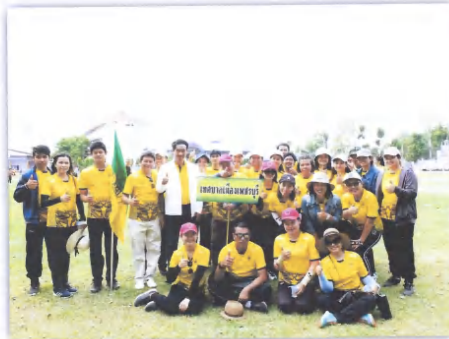
◆ กิจกรรมกีฬาसनนิบาตเทศบาลจังหวัดเพชรบุรี